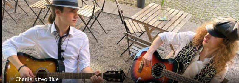
Charlie is two Blue