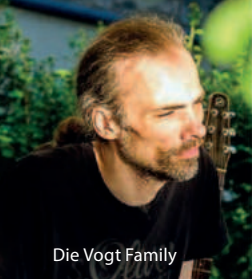
Die Vogt Family