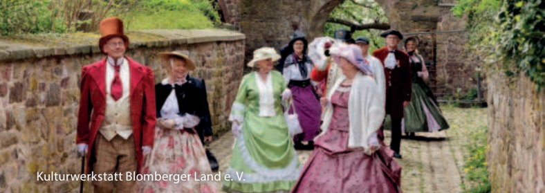
Kulturwerkstatt Blomberger Land e. V.