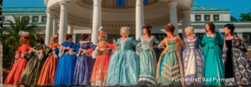
Fürstentreff Bad Pyrmont